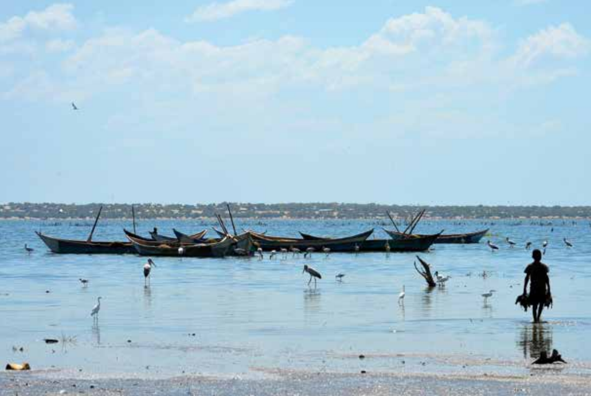
Lake Turkana: noch hat es genug Fische