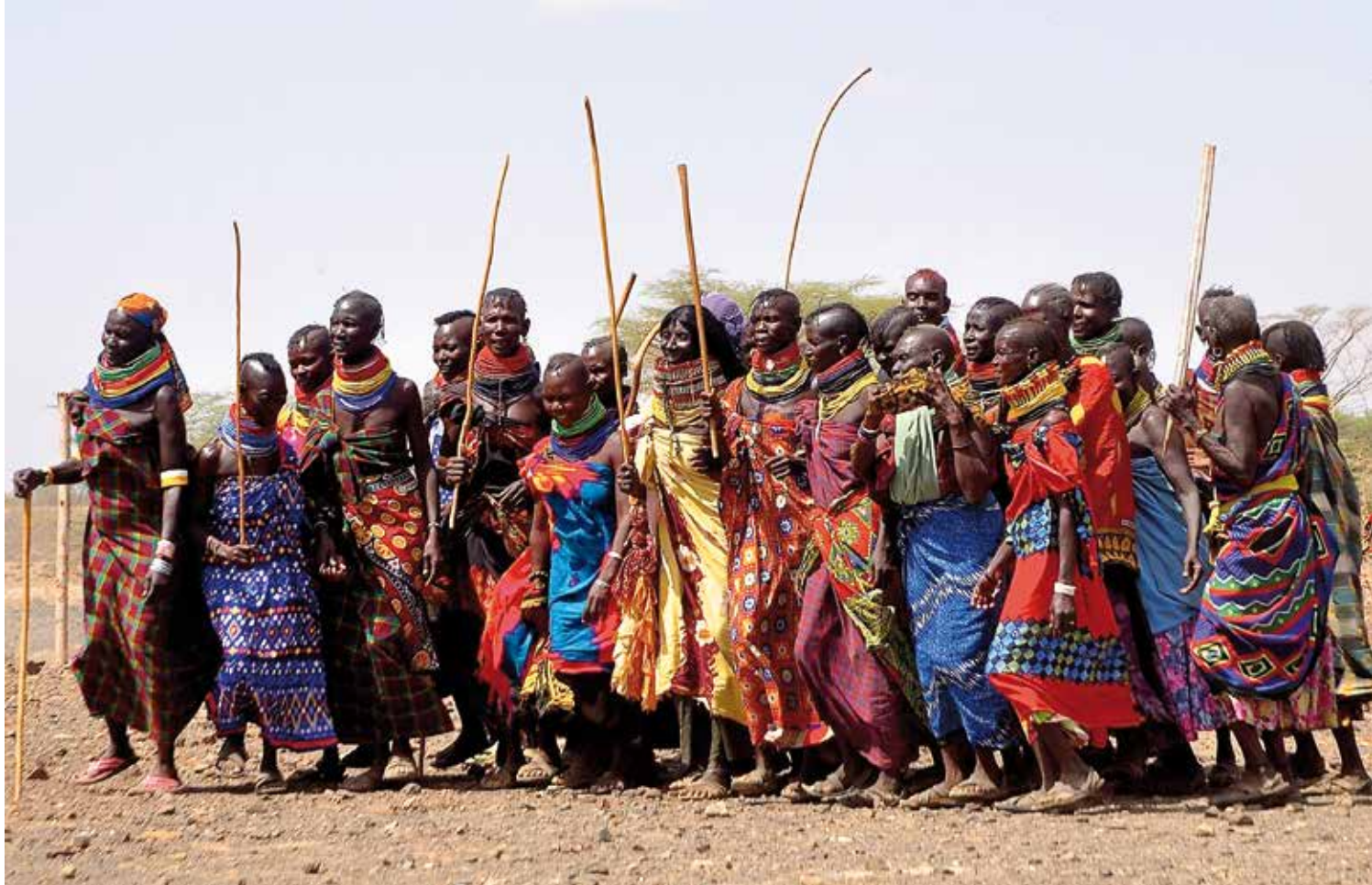
Tanzende Turkana-Frauen